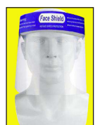
Gelaatsscherm Procuranummer 13.48.23