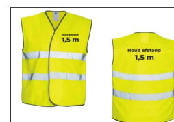
Hesjes Procuranummer 13.48.21