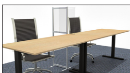
Wand smal tussen stembureauleden Procuranummer 13.48.01