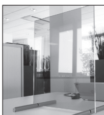
Bureaustandaard Procuranummer 13.48.03