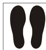
Sticker: Voetstappen Procuranummer 13.48.19