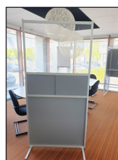
Scheidingswand met loketfunctie Procuranummer 13.48.05